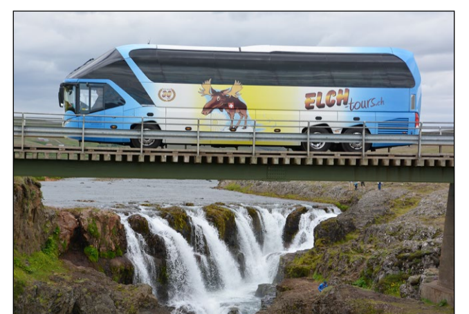
Die Gerbers waren auch auf einer Islandtour mit ihrem Bus. Die bekannten Kolfossar-Wasserfälle waren Programm.