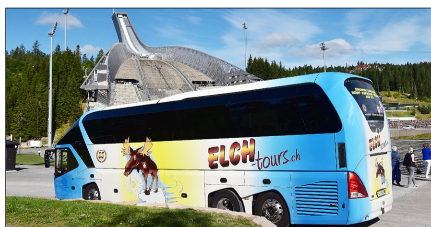
In Oslo in Norwegen durfte der Besuch bei der berühmten Skischanze Holmenkollen nicht fehlen.