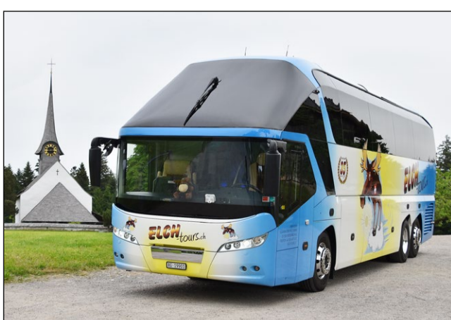
Die Kirche Würzbrunn in der Emmentaler Gemeinde Röthenbach steuerten die Gerbers bei einem Tagesausflug an.