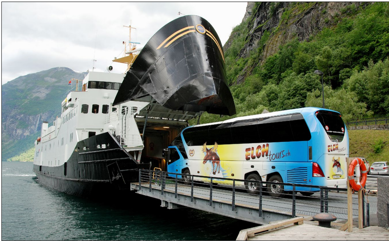
Die Fähre Geiranger in Hellesylt verschluckte in Norwegen buchstäblich den «Elch» in ihrem Schiffsmagen.