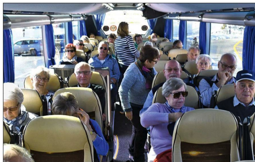
Der Blick in den modernen und komfortablen Reisebus