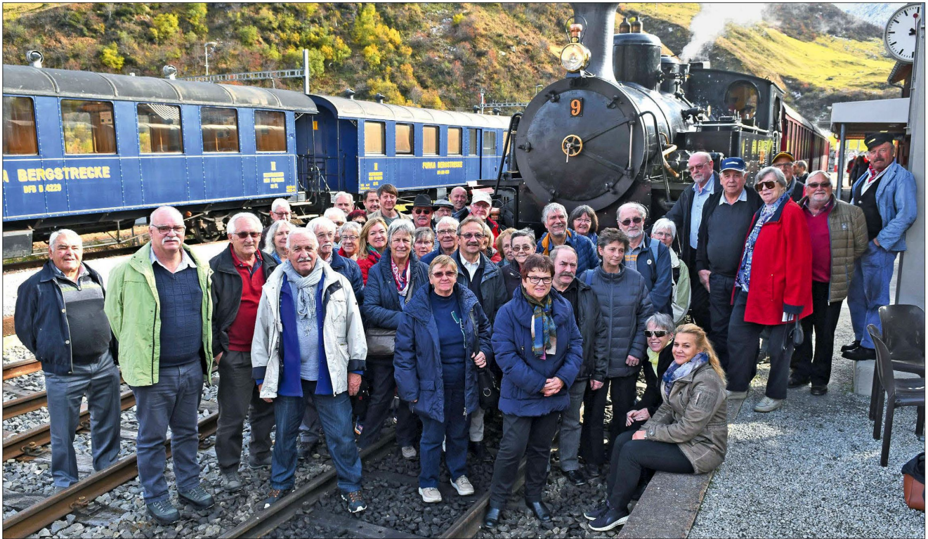
Gruppenbild an der Endstation in Realp. Im Hintergrund die Dampflokomotive der Furka Bergstrecke, links hinten eine blaue Wagenkomposition, die früher auf der Brünigbahn fuhr.

Leserreise mit Heiri Reisen, Elch-Tours führte in die Aareschlucht, über den Grimselpass nach Oberwald. Dort ging's nostalgisch weiter