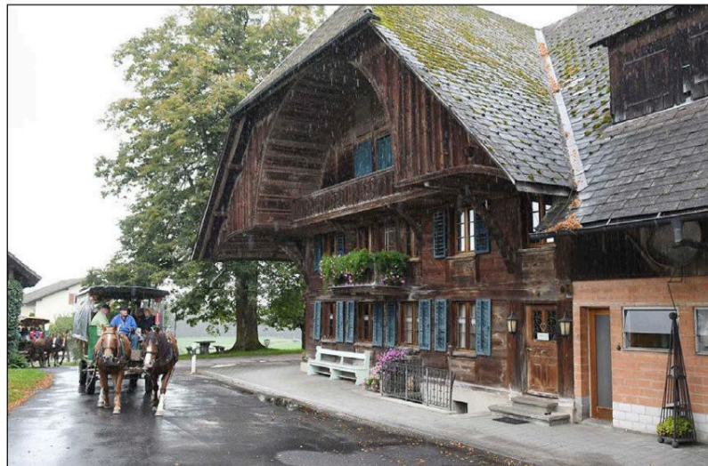
Das Wetter war für eine Kutschenfahrt im Emmental garstig, die Landschaft mit alten Bauernhäusern wie zu Gotthelfs Zeiten umso schöner.

spielte, war die Fahrt ein eindrückliches Erlebnis. Man wählte sich beinahe in einer Verfilmung von Franz Schnyder, der fünf Romane Gotthelfs auf die Leinwand gebracht hatte. Nach der Kutschenfahrt ging es mit dem modernen Starliner-Car wieder zurück nach Mellingen.